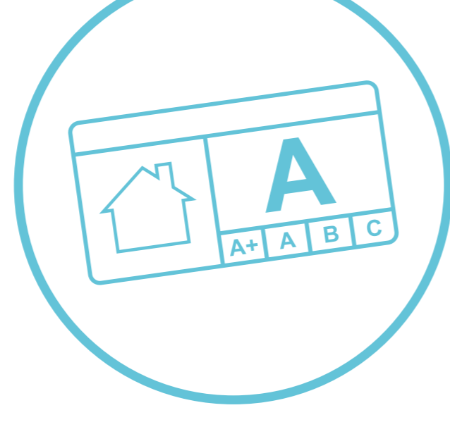
Qualité sanitaire des matériaux