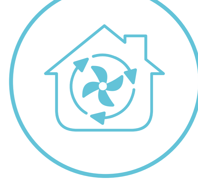
Isolation et ventilation efficaces